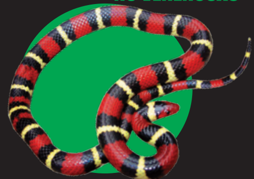
Serpiente rey escarlata