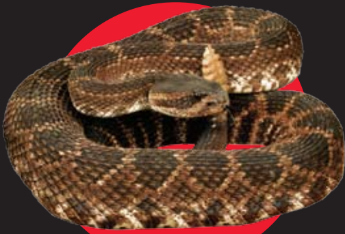
Serpiente oriental de cascabel (crótalo) de dorso de diamante