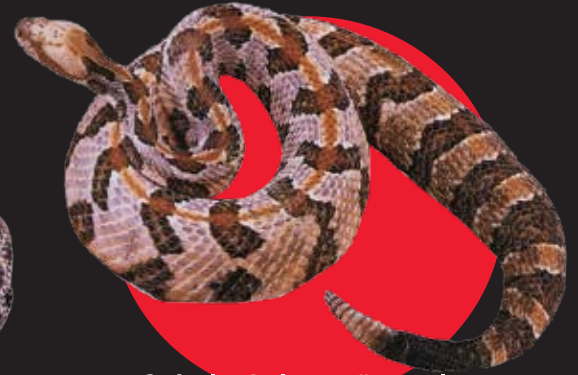
Crótalo de los cañaverales