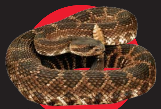
Serpiente oriental de cascabel (crótalo) de dorso de diamante