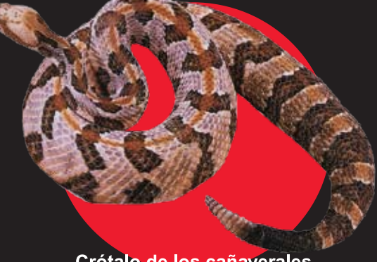
Crótalo de los cañaverales