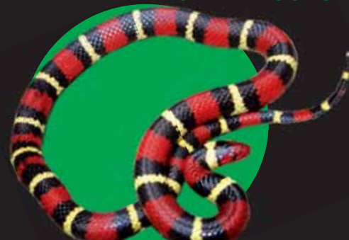
Serpiente Rey Escarlata