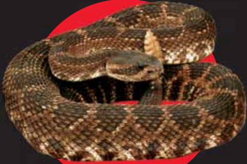
Serpiente oriental de cascabel (crótalo) de dorso de diamante