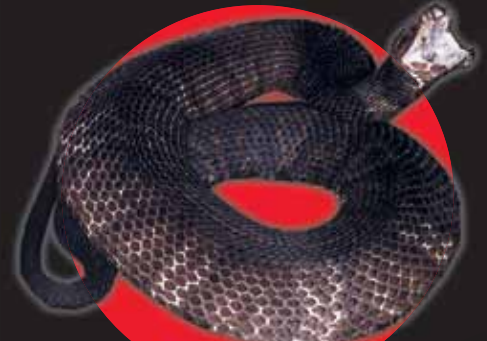
Mocasin de agua

Cabeza triangular grande, pupilas elípticas, cavidad sensorial presente entre las fosas nasales y el ojo.